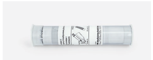
Kunststoffrohr, ideal für Notfalltaschen. Maße: 23 cm (L), Ø 5 cm